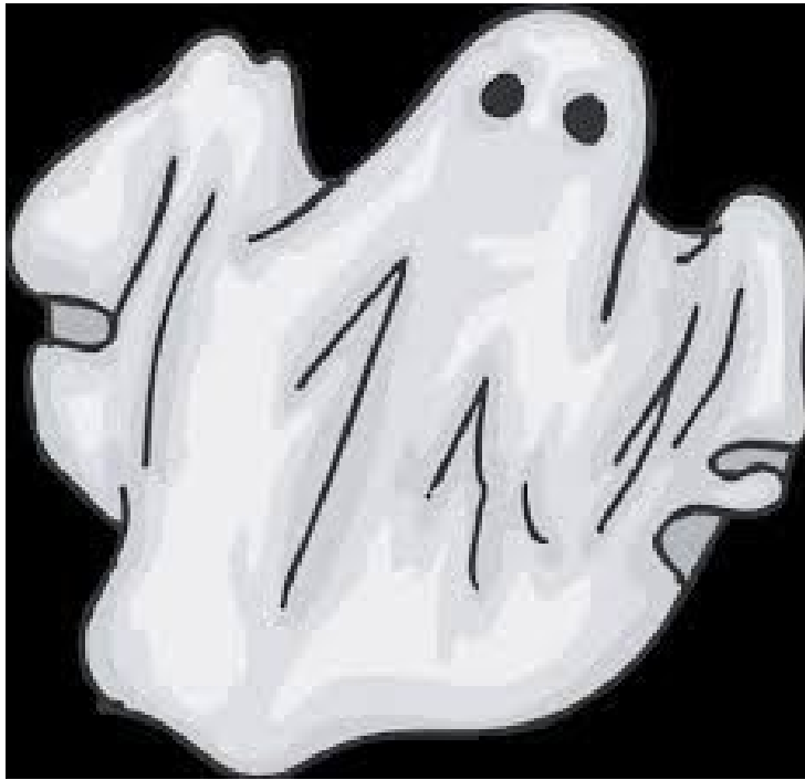
Invadenti ed abusivi

Un'autentica casta di privilegiati, che, quando non risiedono in maestosi castelli, occupano austere dimore; tipo ville d'epoca o, ma è già un'eccezione, spaziosi attici di antichi e signorili palazzi. Mai sentito di soggetti adattatisi a vivacchiare in cadenti catapecchie e nemmeno in alloggi di edilizia popolare. Se son vissuti in quegli edifici prima del decesso non c'è ragione che debbano privarsene da defunti. Tanto più che il loro stato anagrafico li esonera dalle spese condominiali, possono fregarsene dell'Irpef quanto dell'Ici e non devono nemmeno preoccuparsi della manutenzione degli infissi, dal momento che riescono a transitare direttamente attraverso i muri. Gasolio e metano arrivano alle stelle? E chi se ne frega? D'inverno come in estate a loro basta un pratico lenzuolo. Semmai dovranno preoccuparsi che la dimora sia lontana dallo smog causato dal traffico quanto basta per non dover portare di continuo il sudario in lavanderia. Ormai si risparmiano anche la scoccatura delle catene; un tempo indispensabili per tenere lontani i rompilogioni, ma rese ormai obsolete dalla banale quotidianità di ben altri rumori ed orrori. Se ne individuate qualcuno ancora condizionato dall'uso potrebbe trattarsi d'un incallito tradizionalista o, più semplicemente, del fantasma di qualche imprenditore metalmeccanico.